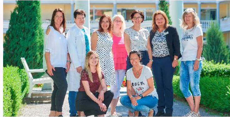
Kaiser Trajan Team

Soldaten mit körperlichen Begleiterkrankungen werden durch unser fachärztliches Team selbstverständlich auch im Rahmen der Präventivkur betreut und behandelt. Akute Notfälle oder Erkrankungen, die eine spezielle medizinische Behandlung notwendig machen, werden umgehend in die mit unserer Kurklinik kooperierenden Akutkliniken, Krankenhäuser unserer Region in Kelheim, Landshut und Regensburg verlegt.