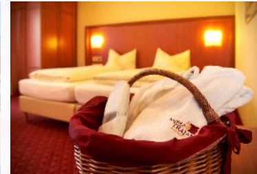
Moderne Zimmer, neu renoviert