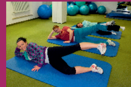
Gymnastikraum und vieles mehr ...