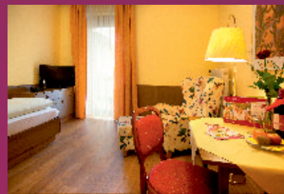
Komfortzimmer mit SAT-TV, Du./WC